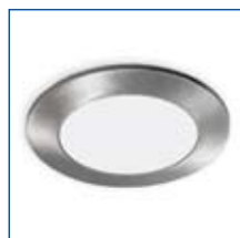
Hochwertiger Metallring Edelstahl-Optik gebürstet