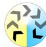
Farbtemperatur umschaltbar 3.000K/4.000K/6.000K